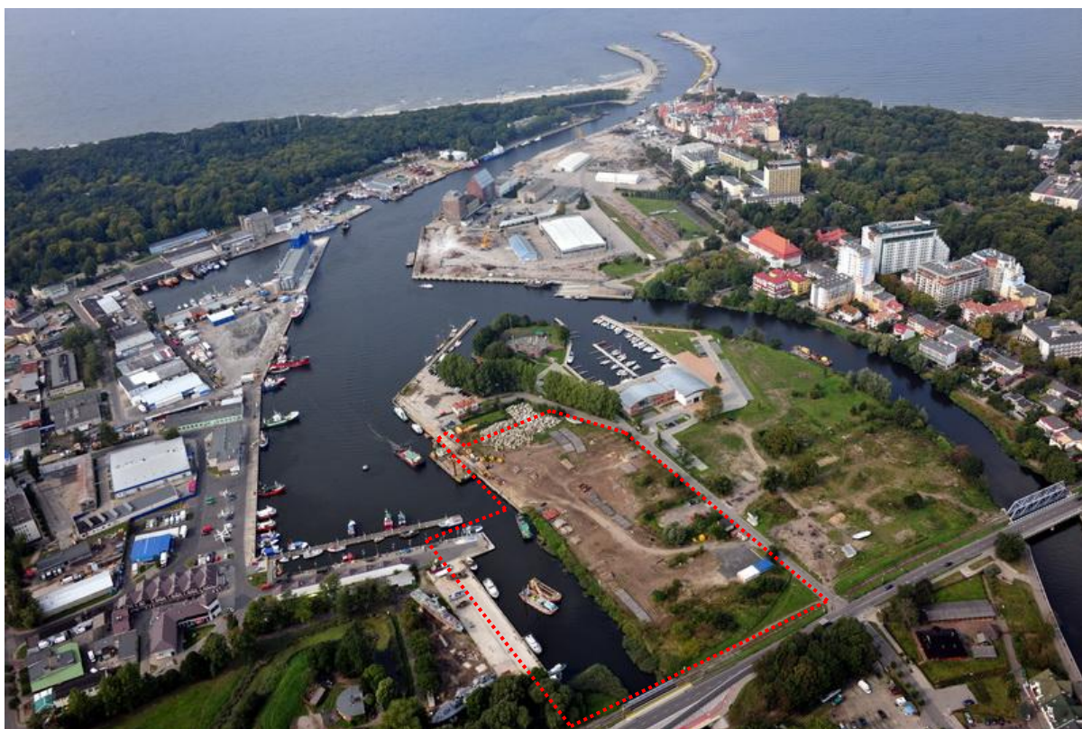
Fot. 1. Teren opracowania - basen rybacki

Teren inwestycji znajduje się w granicach administracyjnych portu morskiego w Kołobrzegu.