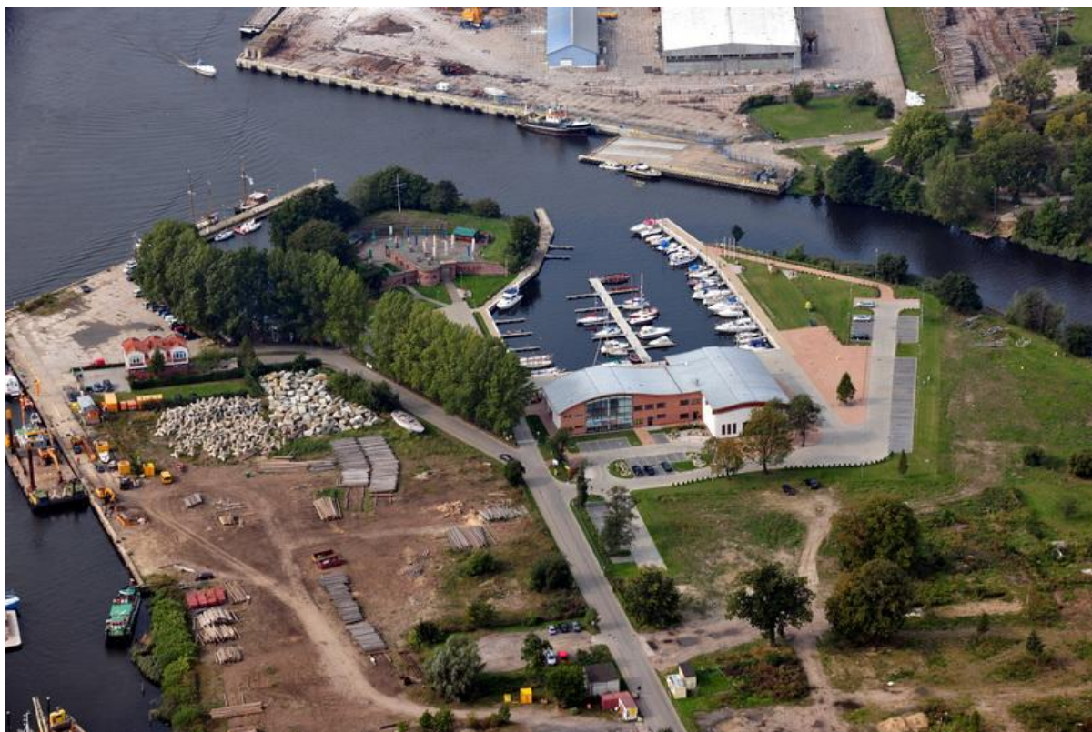
Fot.2. Teren opracowania – basen rybacki