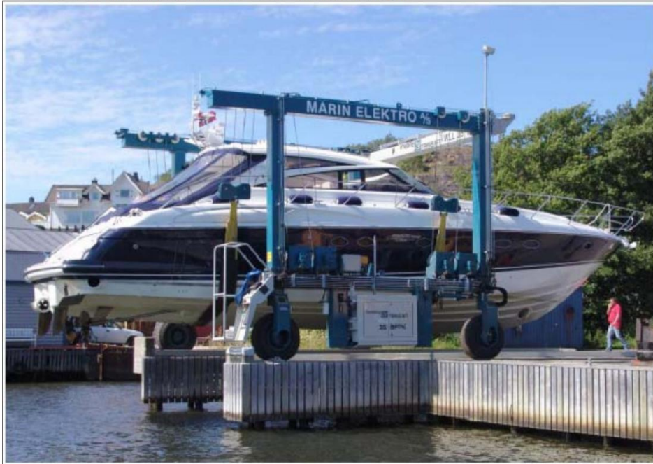
Model 35BFM II bei Marin-Elektro A/S in Fredrikstad, Norwegen